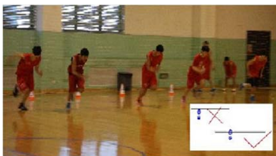
图 1 脚踩过边线正、误示意图

2) 间歇期，测试者到起点处休息，在提示“还有 30 秒”时，到起点处自己的号位处准备，裁判员在“还有 5 秒钟”时开始倒计时发令。